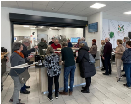
Pensionist:innen live dabei: So funktioniert der Arbeitsalltag im Verteilzentrum.