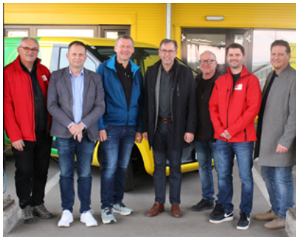
Personalvertretung in der Zustellbasis 4470 Enns zu Gast